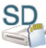
SD Card (L:)