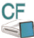
Compact Flash (J:)