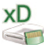
xD Picture (K:)