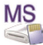
Memory Stick (M:)

Możesz teraz odczytać lub zapisać dane na karcie.