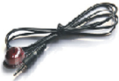
IR verici uzatma kablosu * 1 adet