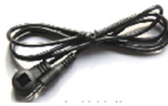
IR alıcı uzatma kablosu * 1 adet