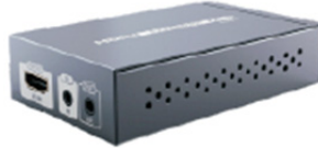
HDMI'den HDBaseT TX vericiye *1 adet