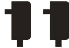
DC 12 V/2 A *1 adet