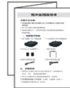
Kullanıcı kılavuzu * 1 adet