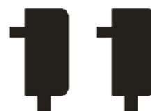
DC 12V/2A *1 stuk