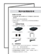
Gebruikershandleiding *1 stuk