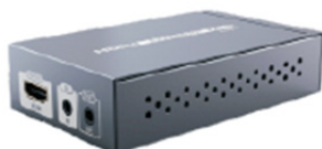
HDMI naar HDBaseT TX-zender *1 stuk