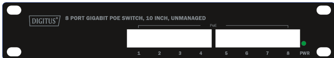
Abbildung 1. Ansicht der Frontblende