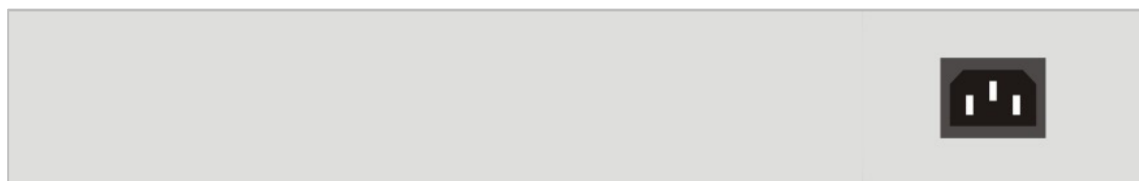
Abbildung 2. Ansicht der Rückseite