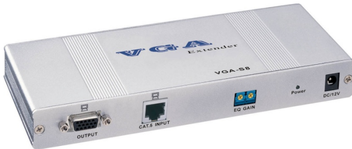
DC-53602 / DC-53702

dell'input del connettore RJ-45 del DC-53402/DC-53602/DC-53702.