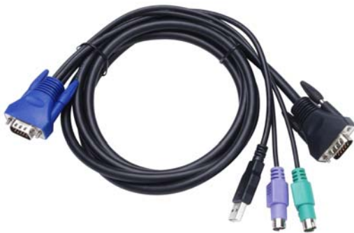
Abb. 1: 4-zu-1-Spezialkabel

Bitte befragen Sie Ihren Händler, wo Sie die KVM-Spezialkabelsätze erwerben können.