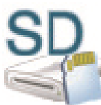
SD Card (L:)