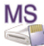
Memory Stick (M:)