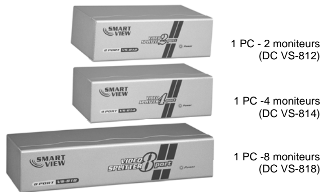
1 PC - 2 moniteurs (DC VS-812)