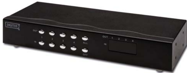
(DC-48101) 4 entradas 4 salidas