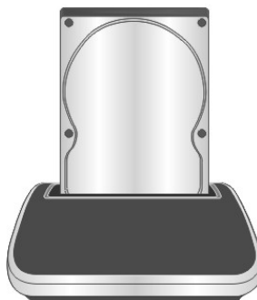
Instalación del HDD de 3.5"