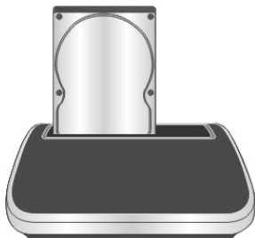
Instalación del HDD de 2.5"