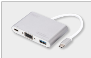
USB 3.0 Type-C™ VGA Multiport