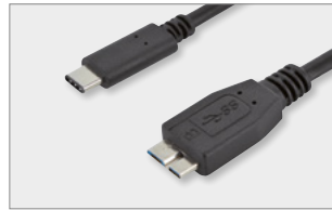
Type-C™ - micro B, M/M