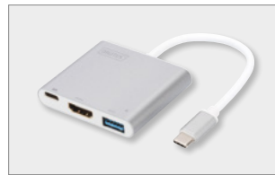
USB 3.0 Type-C™ HDMI Multiport