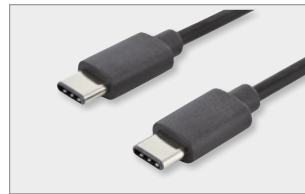
Type-C™ - C, M/M