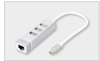
USB 2.0 3-Port Hub & Fast Ethernet LAN Adaptor with Type-C™ Connector