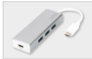
USB 3.0 3-Port Hub with Type-C™ Power Delivery Function