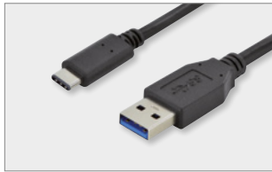
Type-C™ - A, M/M