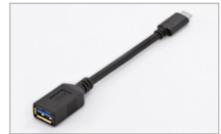
Type-C™ - A, M/F